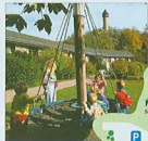
Drehkarussell mit Blick auf die Wildenburg